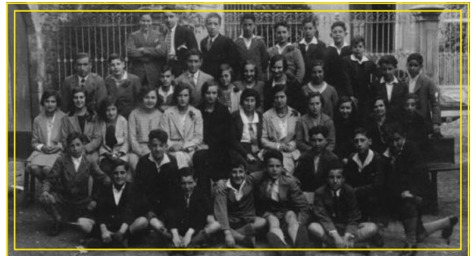
Oñatiko bigarren maillako institutoko ikasliak 1929-1930 ikasturtian. Argazkixan hainbat emakume ikusi leike: irakasle bat edo beste kenduta, beste guztiak ikasliak dira.

1936ko uztaillian gerriak urten eben, eta hiru urte luzeren ostian frankistak irabazi eta Erregimen Zaharra berrezarri euen. Tartian Oñatiko institutua itxi eta Ley de Enseñanza Primaria ezarrirta hezkuntza mistua debekau zan. Sistema barrixagaz, gehixenak 12 urterekin eskolatik urteten euen. Gaiñera, neskak batxillerra egitteko errebalidia etarateko baldintza bat ifiñi zan 1937.urtian: Servicio Social-ian 6 hillabeteko kurtso bat egin bihar izatia.