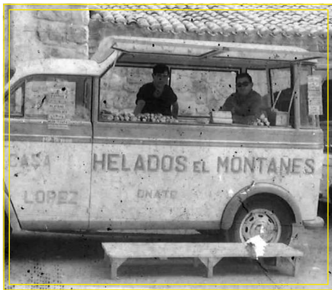
Barkilleruaren furgonetia Arantzazun gozokixak saltzen.

Etxez etxeko salmenta eta merkaua: Salerosketarako plaza ezagunena ganadu-ferixia, eta fruta- eta berdura-plazia izan dira. XX. mendia baiño lehenagotik datorren ohitturia da ferixia: zapatutan egitten zan, herriko plazan. Ganadu-ferixia, berriz, Santa Marina plazan izaten zan. Bertako zein inguruetakoko saltzailliak etorten ziran.