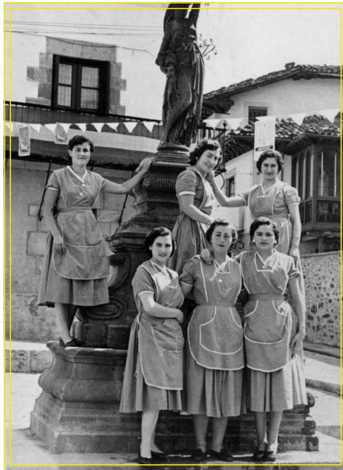
Txaketua tabernako zerbitzarixak (1953).

Diruaren kontrola gizonak eukain, izan be, ezkondu aurretik irabazitako diruaren jabe aitta izaten zan, eta ezkondu ondoren gizona zan etxera dirua ekarten ebena. Hala, 1992. urtian, oraindik be, Oñatiko emakumien %50ek ez eukan inñolako diru-sarrerarik (Astigarraga, 1992: 25).