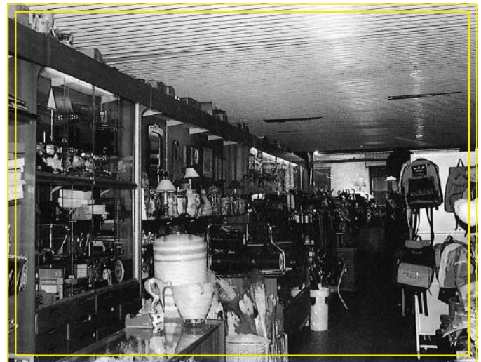
Juanitosa dendia barrutik (1992)

"jana, konserbak...bakaillaua, kafja... jatekua danetik! Espezieiak be bai. Eta gero txoko batian delicatessiak: trufak potetxotan, saltxitxa potia, pateua untaittekua (...) Eta gero eguen drogerixia, papelerixia eta parafarmazia esaten xakon gauzak be bai. Eta mostradoriaren azpitan puntillak, bordauak (...) Gero ferreterixia: bisagrak, zarrailak, ultziak... Barrikatan, anisa eta pattarra, eta, bestekaldian ardaux goxua eta jereza. (...) kolonia be bai, granelian. (...) Aurrerago hari berezixak eta joerixia be bai!" (ARG)